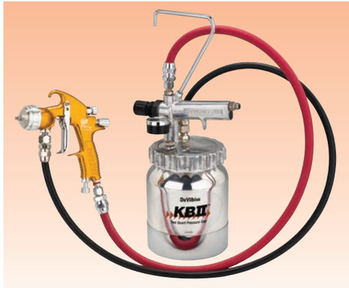
Spritzpistole Pro LITE mit Devilbiss KBII 2l Druckbechersystem für zwei Liter.