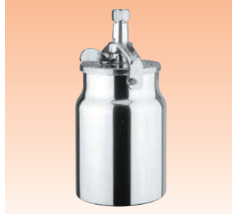
Serienmäßig gehört ein KR-566-1-B-Aluminiumbecher mit 1-Liter-Fassungsvermögen zu allen Sets mit Saugbecherpistole.