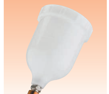
Serienmäßig gehört ein GFC-501-Acetylbecher mit 600-ml-Fassungsvermögen zu allen Sets mit Fließbecherpistole.